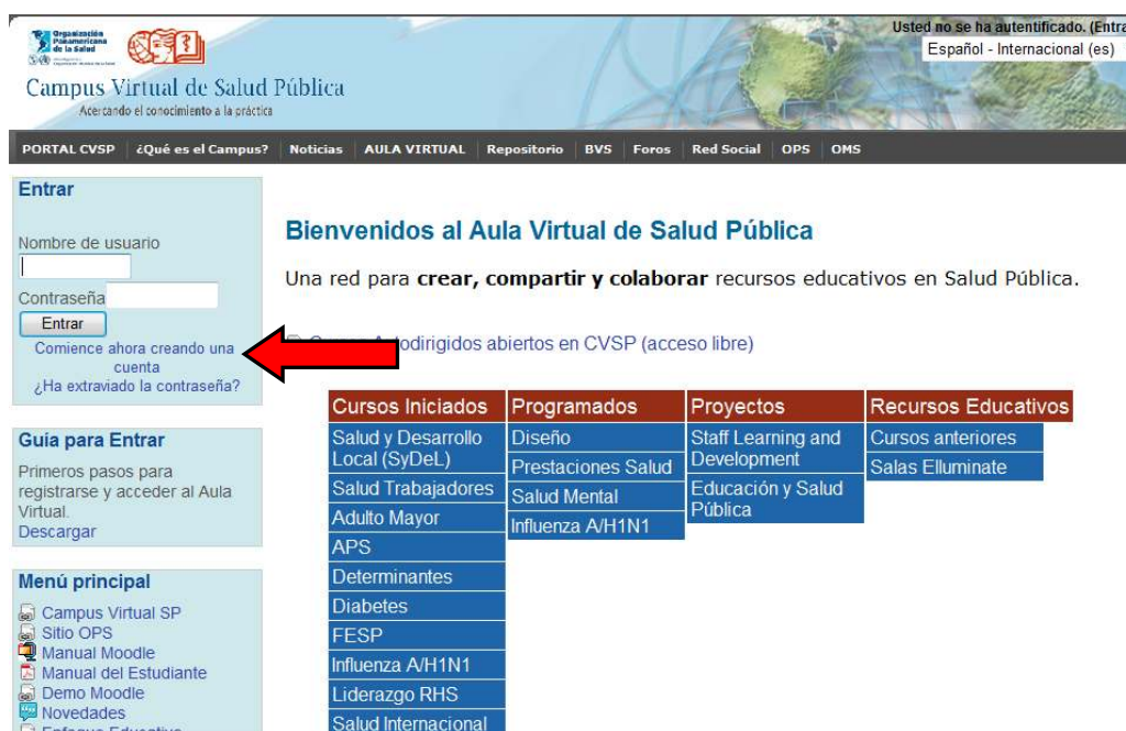
Figura #1. Página Principal del Aula Virtual – Creación de una cuenta