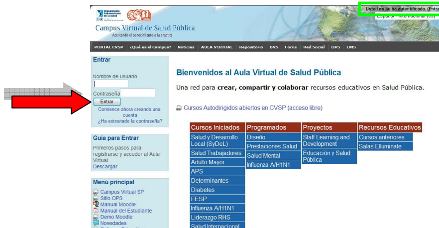
Figura #6. Página Principal del Aula – Ingreso al Aula

Si ha ingresado de forma correcta, su nombre debe aparecer en la parte superior derecha (ver cuadro verde).