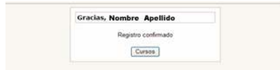
Figura #5. Mensaje del sistema- Registro Confirmado

Al hacer clic sobre el enlace, debe aparecer un mensaje como el siguiente: