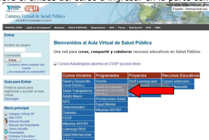
Figura #7. Página Principal – Selección de un curso